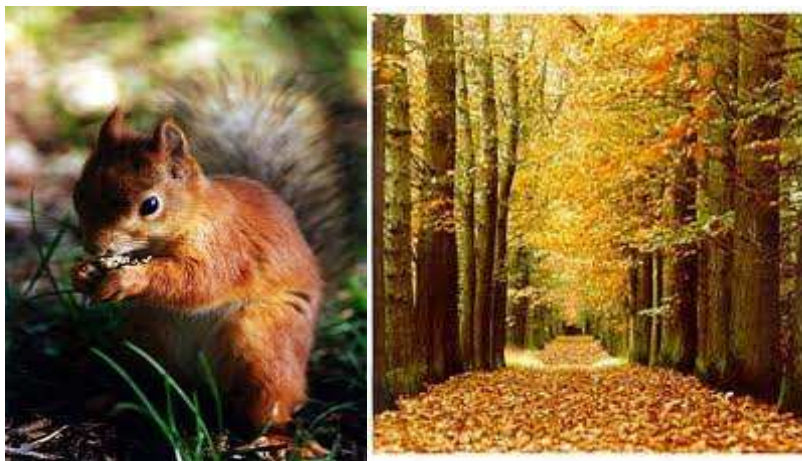
Figuur 5: 'boer Charel in de herfst'