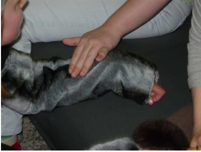
Figuur 6: poes Mies