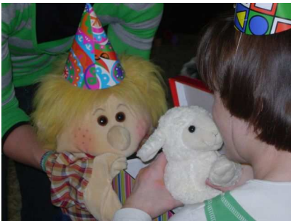
Figuur 7: schaap Bella

Uitleg: Tijdens het verhaal komt poes Mies plotseling tevoorschijn. Ze gaat bij boer Charel die haar aait. Vervolgens gaat poes Mies bij iedereen langs en kunnen ze haar aaien! De meeste mensen deden dit spontaan. Anderen hadden wat tijd nodig om gewend te raken aan poes Mies.