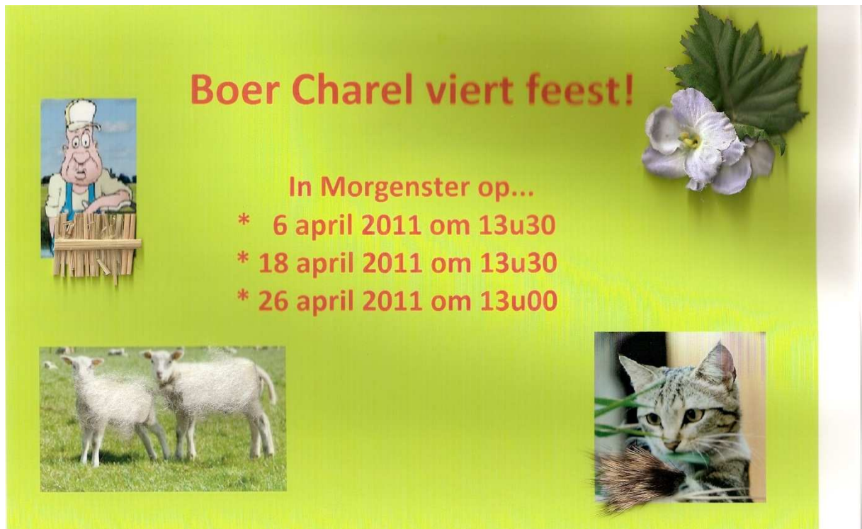
Figuur 1: affiche leefgroep Morgenster

Door gebruik te maken van een affiche, wilden we onze activiteit op voorhand promoten. Het was de bedoeling om deze zowel aan de bewoners als aan de begeleiding van de leefgroepen te tonen. Het doel van de affiche in leefgroep Morgenster, is de bewoners en de begeleiding van de leefgroep nieuwsgierig te maken voor onze activiteit. De gemaakte affiche hingen we omhoog in beide leefgroepen, zodat de bewoners én de opvoeders deze kunnen zien. De affiche geeft de dagen, uren en plaats van de verschillende voorstellingen weer. Ze is bewerkt met voelbaar materiaal die doet denken aan de methode snoezelen. Op deze manier wilden we de affiche aantrekkelijk te maken en een link leggen naar onze sessies, die ook te maken hebben met zintuigprikkeling. De afbeeldingen zijn zo gekozen dat ze allen iets met het verhaal te maken hebben.