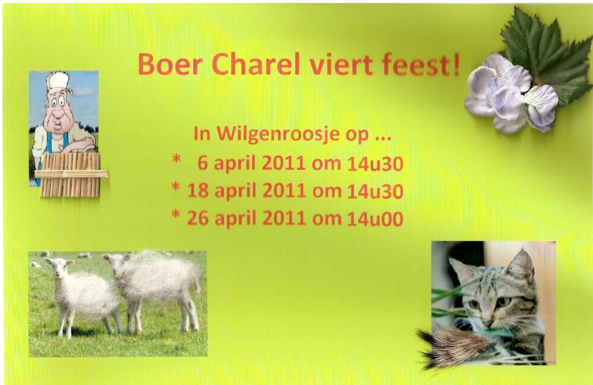
Figuur 2: affiche leefgroep Wilgenroosje

Deze affiche lijkt op degene van leefgroep Morgenster. Ze heeft dan ook dezelfde doelstelling. Het verschil tussen beide affiches, is het tijdstip van de voorstelling. Bij leefgroep Morgenster vond de voorstelling namelijk steeds plaats om 13u30, terwijl deze bij leefgroep Wilgenroosje om 14u30 plaatsvond.