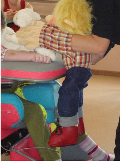
Figuur 11: schaap Bella in Wilgenroosje