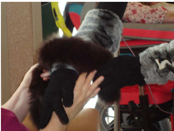
Figuur 10: poes Mies in Wilgenroosje

Bij het begin van het verhaal begroet boer Charel iedereen in de leefgroep. Bij het beginliedje, zwaait hij naar iedereen, waarna hij alle bewoners begroet door hen persoonlijk een hand te geven. Indien de personen het moeilijk hadden om uit zichzelf een hand te geven, wreef boer Charel eens over hun hand en/of wang.