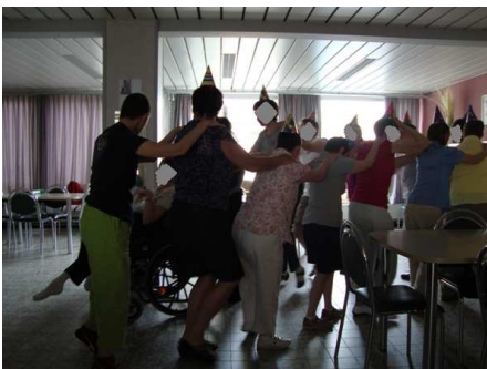
Figuur 8: de polonaise

Uitleg: Boer Charel kreeg een pakje voor zijn verjaardag. Dit maakte de bewoners nieuwsgierig naar de inhoud. Na de bewoners eens in het pakje te laten piepen, bleek dat het om een schaapje gaat. Nadat het schaap tevoorschijn is gekomen, kreeg iedereen de kans om het te aaien.